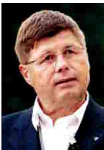
Der Luzerner Gesundheitsdirektor Markus Dürr.

Markus Dürr ist zufrieden. Die Volksinitiative für eine Einheitskrankenkasse wurde an der Urne deutlich verworfen: «Ich hatte mit einem solchen Ergebnis gerechnet. Überrascht hat mich einzig, dass in der Westschweiz die Zustimmung nicht grösser war», sagt der Präsident der kantonalen Gesundheitsdirektorenkonferenz.